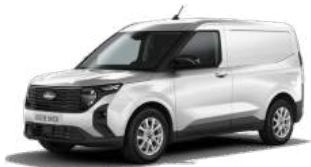
FROZEN WHITE - LAKIER ZWYKŁY bez dopłaty