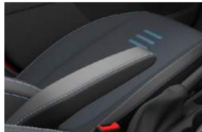
TAPICERKA MATERIAŁOWA Z NIEBIESKIMI AKCENTAMI