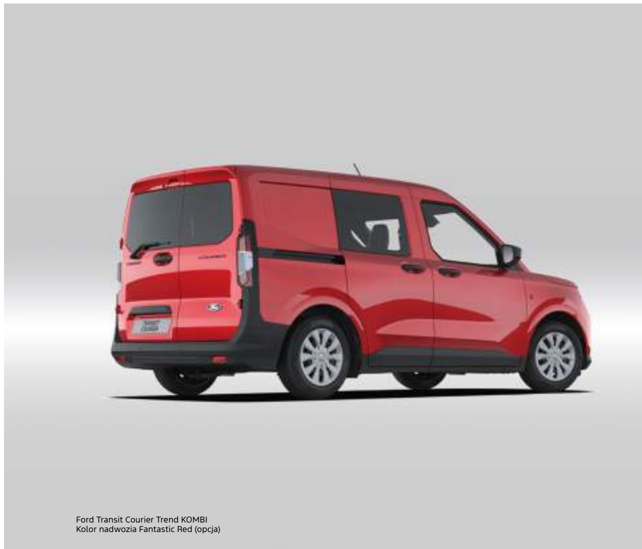
Ford Transit Courier Trend KOMBI Kolor nadwozia Fantastic Red (opcja)

5 000 zł - tylko dla wersji Trend Wszystkie dostępne kolory - szczegóły u dealerów