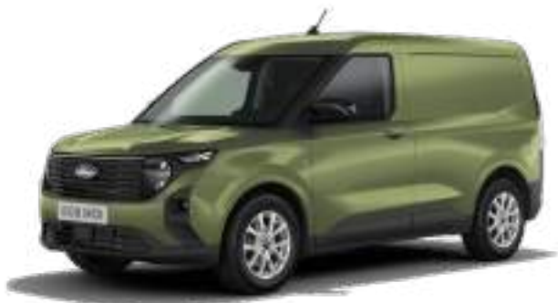
BURSTING GREEN- LAKIER METALIZOWANY