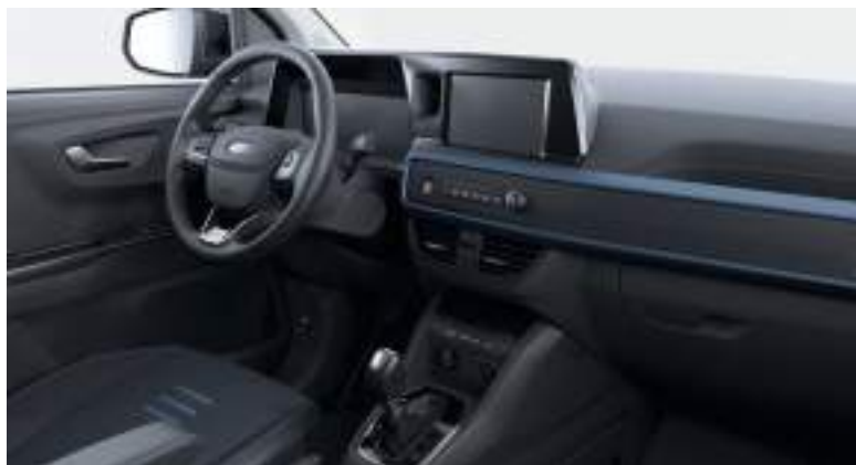
Ford Transit Courier Van w wersji Active z automatyczną skrzynią biegów i tapicerką materiałową (standard)