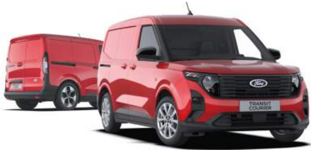
Ford Transit Courier VAN w wersji Limited po lewej stronie - wersja z napędem elektrycznym, po prawej wersja z silnikiem benzynowym lub wysokoprężnym kolor nadwozia Fantastic Red (opcja)