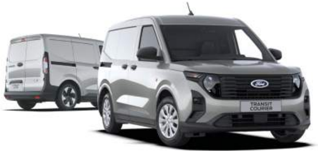
Ford Transit Courier VAN w wersji Trend po lewej stronie - wersja z napędem elektrycznym, po prawej wersja z silnikiem benzynowym lub wysokoprężnym kolor nadwozia Solar Silver (opcja)