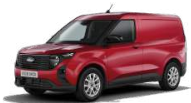
FANTASTIC RED - LAKIER METALIZOWANY 1 400 zł