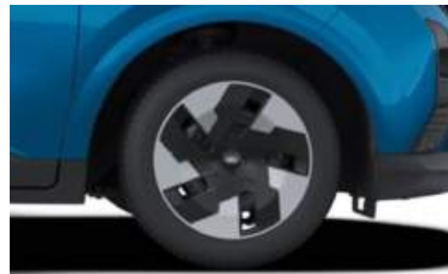
16" STALOWE OBRĘCZE KÓŁ Z KOŁPAKAMI

Standard dla wersji TREND z napędem elektrycznym