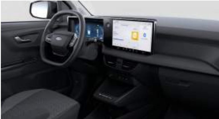
Ford Transit Courier VAN w wersji Limited z napędem elektrycznym