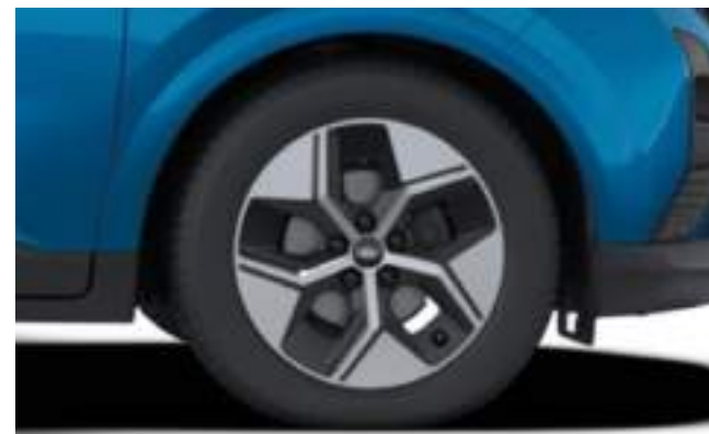
17" OBRĘCZE KÓŁ ZE STOPÓW LEKKICH

Standard dla wersji TREND z napędem elektrycznym