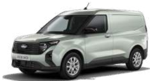
CACTUS Grey - LAKIER ZWYKŁY 1 400 zł