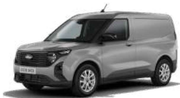
SOLAR SILVER - LAKIER METALIZOWANY 1 400 zł