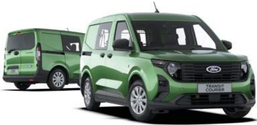
Ford Transit Courier KOMBI w wersji Trend Kolor nadwozia Bursting Green (opcja)