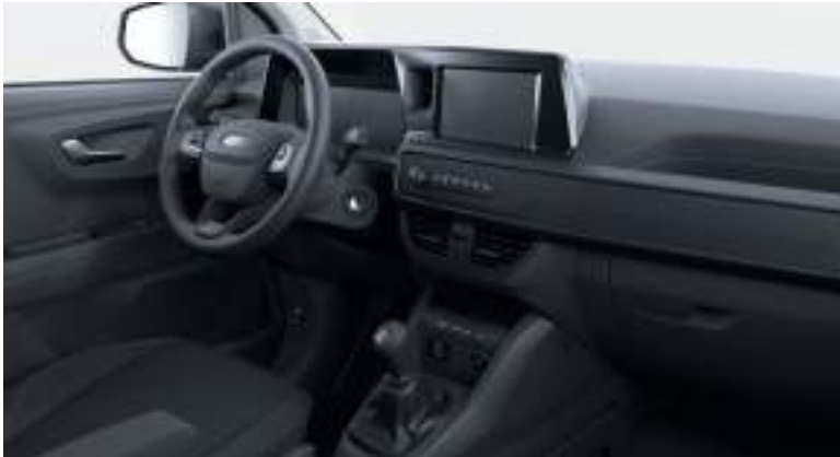
Ford Transit Courier KOMBIN w wersji Trend z manualną skrzynią biegów i tapicerką materiałową (standard)