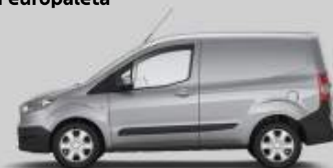
Ford Transit Courier VAN (poprzedni model)

2.9 m 3 maksymalna objętość przestrzeni ładunkowej