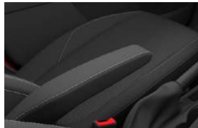
TAPICERKA MATERIAŁOWA W CIEMNEJ TONACJI