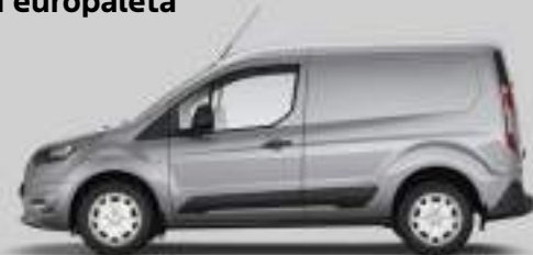
Ford Transit Connect VAN L1 (poprzedni model)