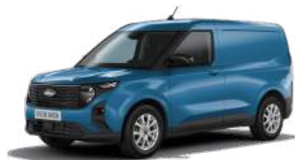
DIGITAL AQUA BLUE - LAKIER METALIZOWANY 1 400 zł