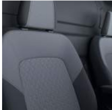
Tapicerka materiałowa (standard)