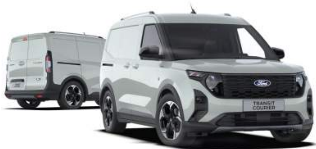
Ford Transit Courier Van w wersji Active Kolor nadwozia Cactus Grey (opcja)