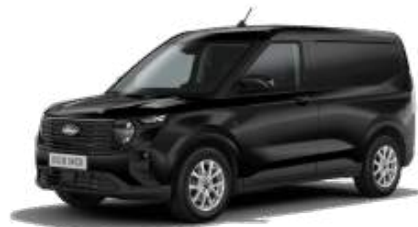
AGATE BLACK- LAKIER METALIZOWANY 1 400 zł