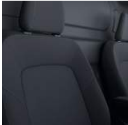
Tapicerka materiałowa (standard)